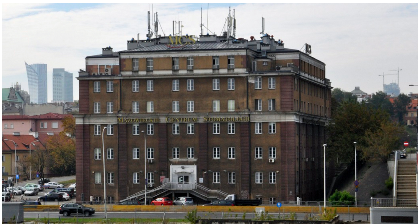
Siedziba Mazowieckiego Biura Planowania Regionalnego